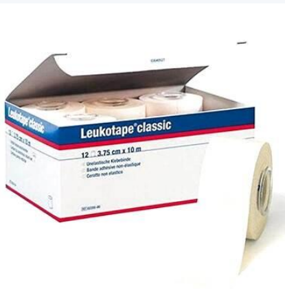
Caja abierta — 12 unidades Vendajes individuales 3.75 cm × 10 m