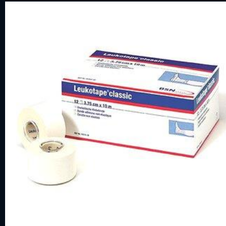
Leukotape® Classic — 12 unidades/caja 3.75 cm × 10 m · REF. 02305-06

Rígido · No elástico · Alta adherencia · CE · ISO 10993