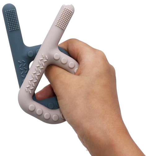
Agarre ergonómico — mango diseñado para control motor