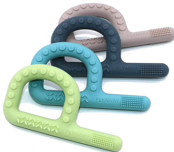
Set de 4 colores — texturas y resistencias diferenciadas

Indicado para integración sensorial oral, reducción de hipersensibilidad, estimulación de conciencia bucal y apoyo en el proceso de adquisición del habla. Disponible en 4 colores / texturas para protocolos de estimulación progresiva. Resistente a temperaturas extremas (-40 °C a +200 °C) y esterilizable.