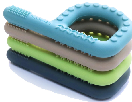
Diseño apilable — 4 texturas progresivas